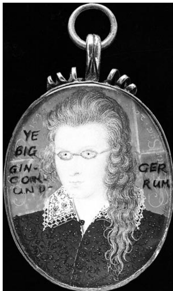
Надпись на медальоне: Большая головоломка с рыжей шевелюрой