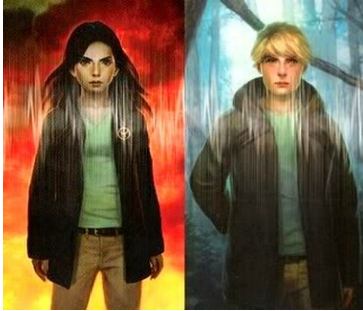
Katniss and Peeta