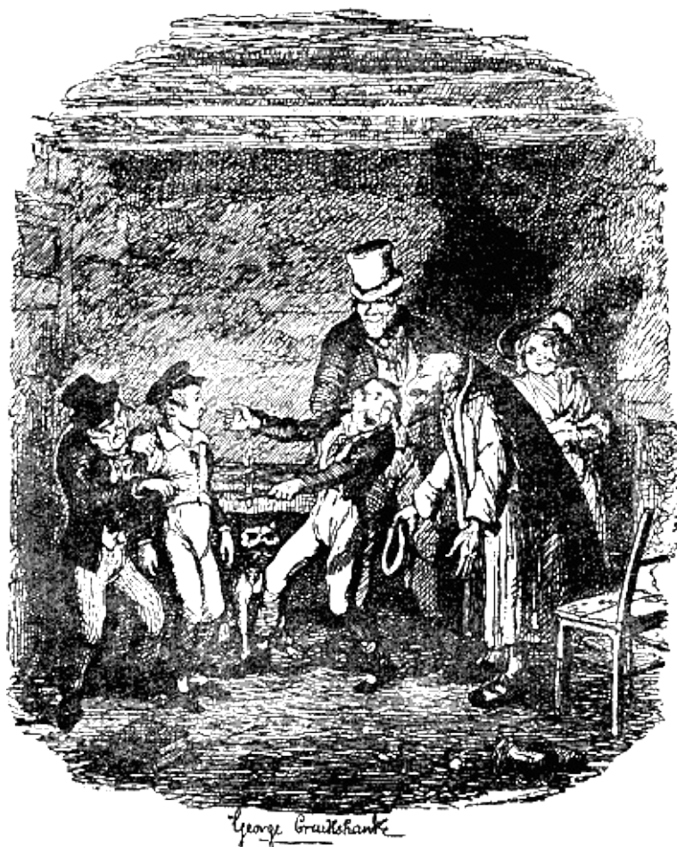
— Посмотрите на его костюм! Вот так потеха!

— Это книги старого джентльмена! — ломая руки, воскликнул Оливер. — Доброго, славного старого джентльмена, который приютил меня и ухаживал за мной, когда я чуть не умер от горячки! О, прошу вас, отошлите их назад, отошлите ему книги и деньги! Держите меня здесь до конца жизни, но отошлите их назад. Он подумает, что я их украл. И старая леди и все, кто был так добр ко мне, подумают, что я их украл! О, сжальтесь надо мной, отошлите их!