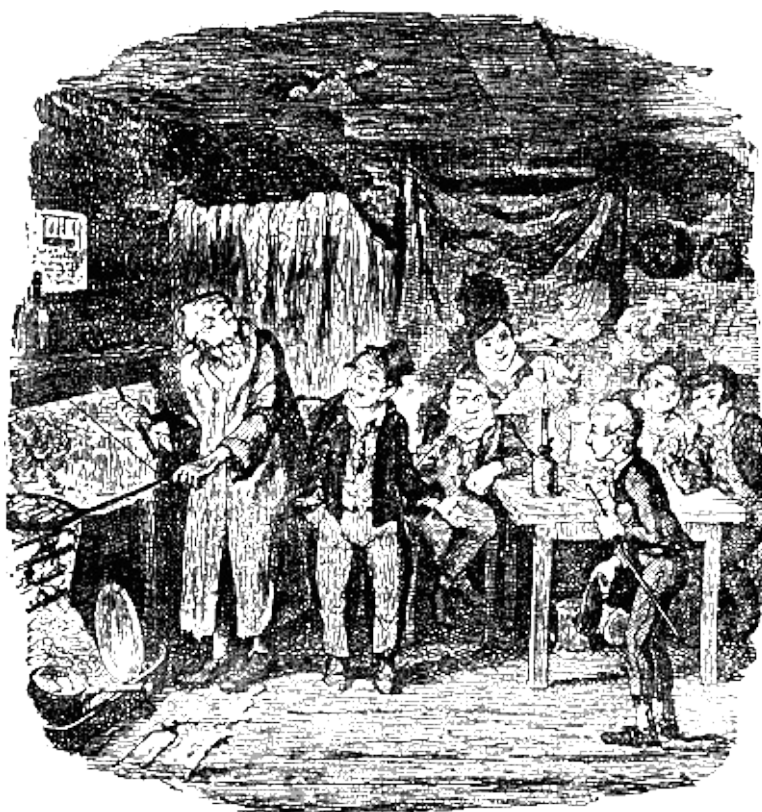
— Это он самый и есть — мой друг Оливер Твист.

Оливер подумал, не лучше ли ему улизнуть, но они уже спустились с холма. Проводник, схватив его за руку, отворил дверь дома около Филдлепп, втащил его в коридор и прикрыл за собой дверь.