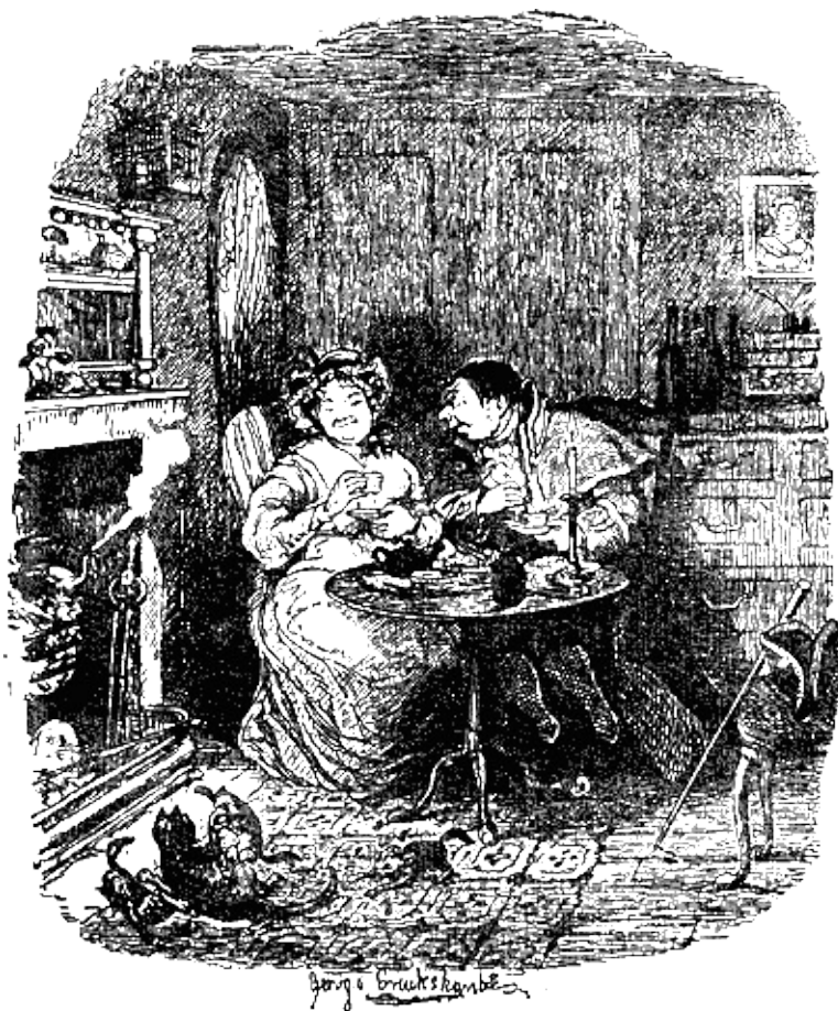
Мистер Бамбл, помаленьку передвигая свой стул, начал уменьшать расстояние, отделявшее его от надзирательницы.

этом он устремил взгляд на миссис Корни; и если бидл может быть нежен, то таким бидлом был в тот момент мистер Бамбл.