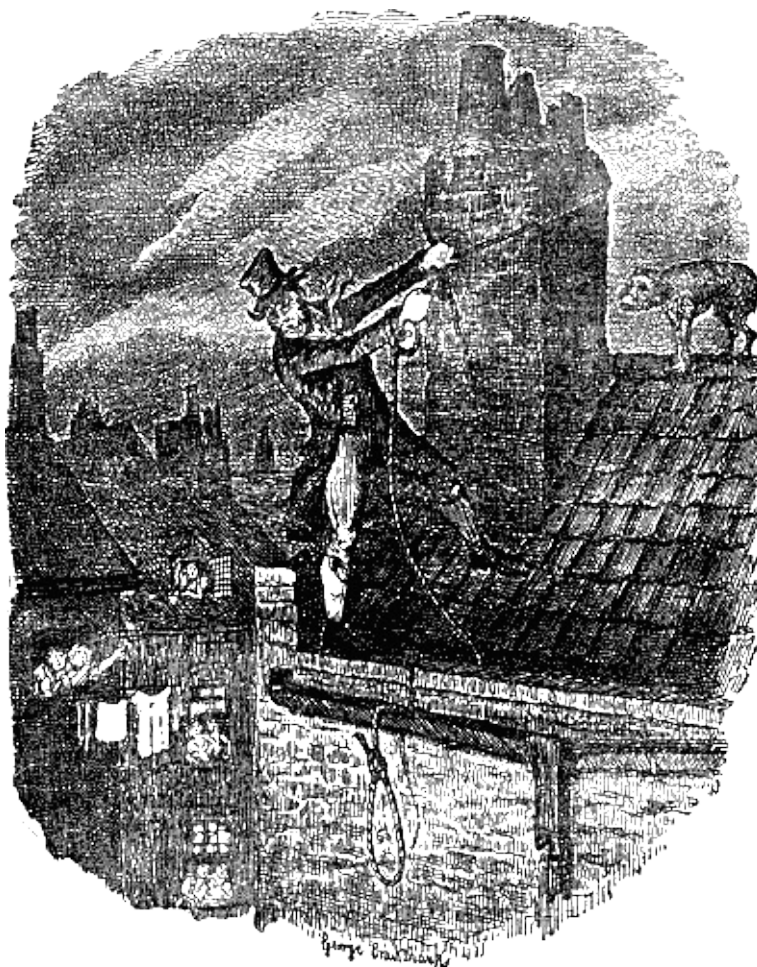
Он оперся ногой о дымовую трубу и крепко обвязал вокруг нее один конец веревки.

Со стороны фасада спешили люди — вперед и вперед, — могучий, бурный поток яростных лиц, то там, то сям озаряемых пылающими факелами. В дома по ту сторону канала ворвалась толпа; в каждом окне виднелись лица; люди гроздьями лепились на каждой крыше. Каждый мостик (а отсюда видно было три моста) прогибался под тяжестью толпы. А поток людей все катился, — отыскивая какое-нибудь местечко, откуда можно было хоть на секунду увидеть негодяя и выкрикнуть какое-нибудь проклятье.