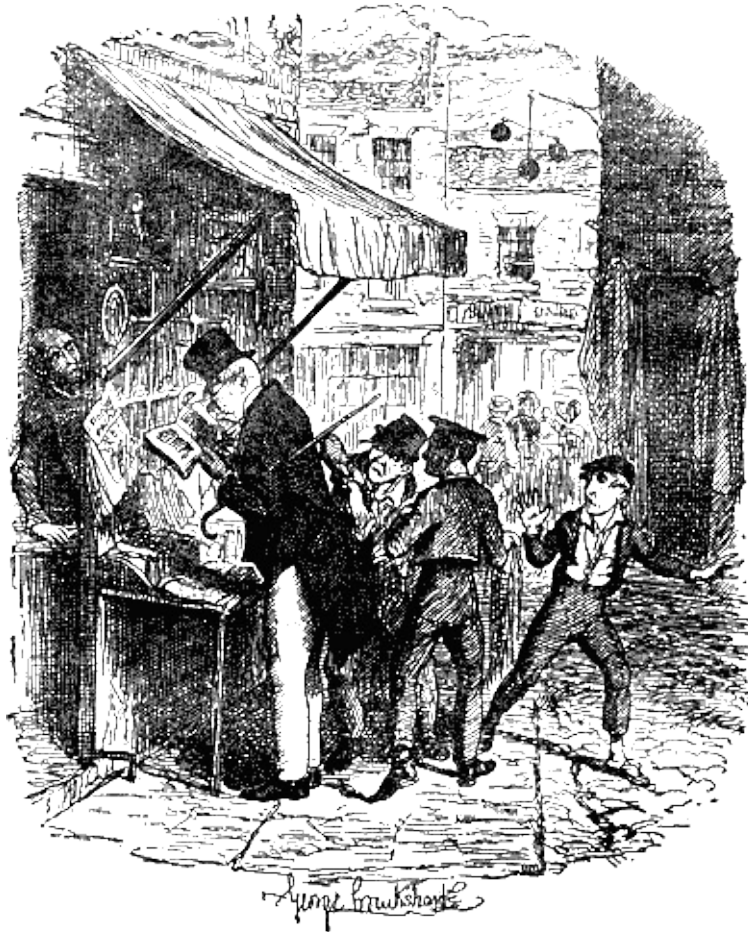
Плут засунул руку в карман старого джентльмена.

поместительным, что казалось, его костюм весь состоит из них. Это так не нравилось Оливеру, что он собирался заявить о своем намерении идти назад, как вдруг мысли его приняли другое направление, так как поведение Плута весьма загадочно изменилось.