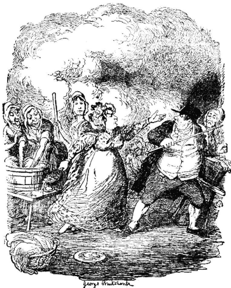
Миссис Бамбл схватила коши с мыльной пеной и, указав на дверь, приказала ему немедленно удалиться.

Мистер Бамбл растерялся от неожиданности и был разбит наголову. Он отличался несомненно склонностью к запугиванию, извлекал немалое удовольствие из мелочной жестокости и, следовательно (что само собой разумеется), был трусом. Это отнюдь не порочит его особы, ибо многие должностные лица, к которым относятся с великим уважением и восхищением, являются жертвами той же слабости. Это замечание сделано скорее в похвалу ему и имеет целью внушить читателю правильное представление о его пригодности к службе.