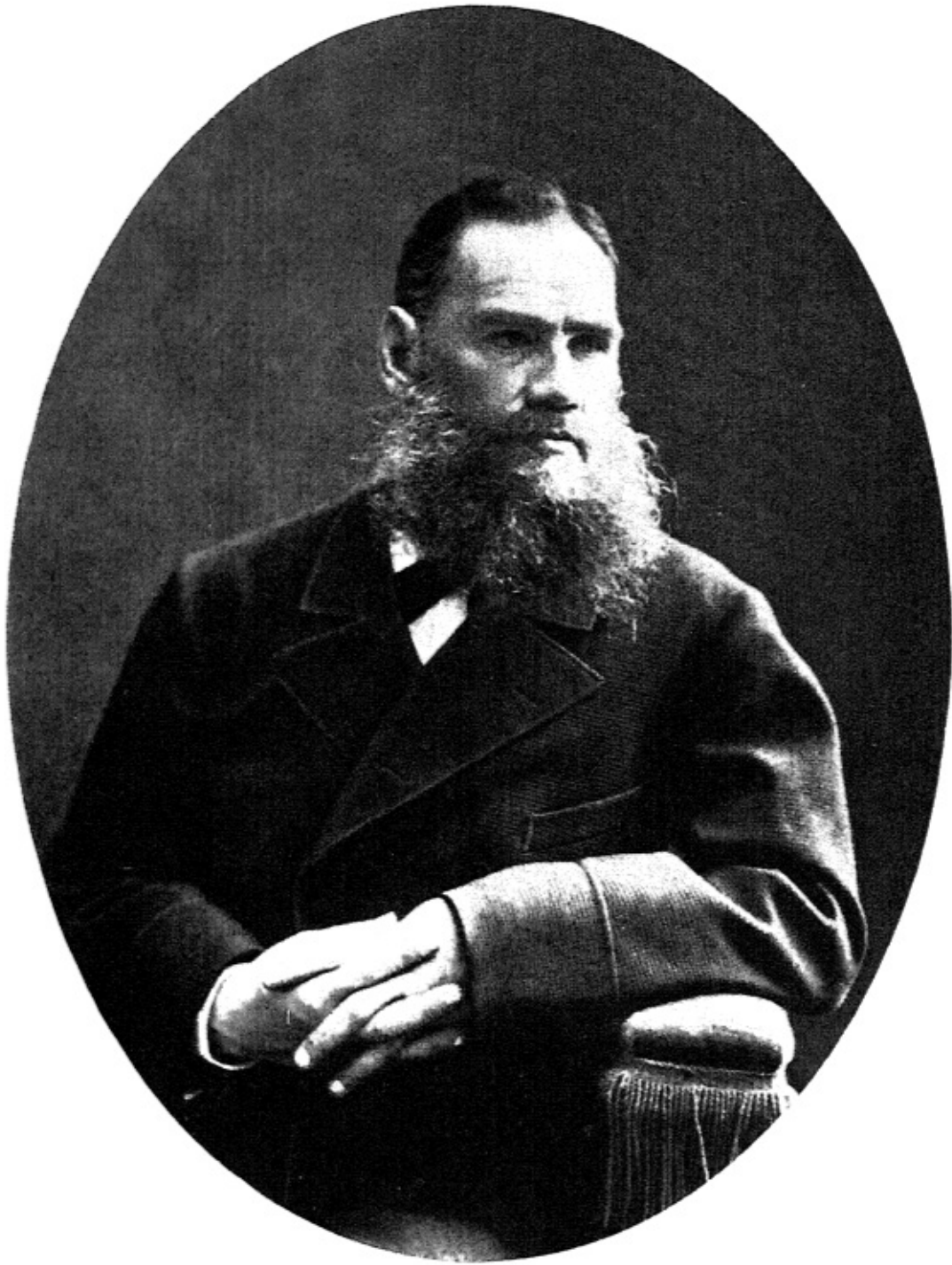
Л. Н. ТОЛСТОЙ. 1881 г.